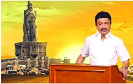
తెలిపారు. సునామీ సమయంలో కూడా తిరువళ్ళువర్ గంభీరంగా నిలిచారు. ఇందుకు సంబంధించి డిజిటల్ టెక్నాలజీ ద్వారా పలు పోటీలు నిర్వహించనున్నట్లు తెలిపారు.

విల్లివాకం న్యూస్: రాష్ట్ర ప్రభుత్వం తరపున తిరువళ్ళువర్ విగ్రహం సిల్వర్ జుబ్లీ వేడుకలు నిర్వహించనున్నట్లు ముఖ్యమంత్రి స్టాలిన్ తెలిపారు. కన్యాకుమారిలోని తిరువళ్ళువర్ విగ్రహాన్ని జనవరి 1, 2000న అప్పటి ముఖ్యమంత్రి కరుణానిధి ఆవిష్కరించారు. విగ్రహం 25వ వార్షికోత్సవాన్ని వచ్చే నెలలో నిర్వహించనున్నారు. అనంతరం తమిళనాడు ప్రభుత్వం తరపున వళ్ళువర్ విగ్రహానికి రజతోత్సవం నిర్వహించనున్నారు. ఈ సందర్భంగా ముఖ్యమంత్రి ఎం.కె.స్టాలిన్ మంగళవారం విడుదల చేసిన వీడియోలో మాట్లాడుతూ డిసెంబర్ 31, జనవరి 1వ తేదీల్లో తమిళనాడు ప్రభుత్వం వల్లూవర్ విగ్రహం రజతోత్సవాలను నిర్వహించనున్నట్లు తెలిపారు.